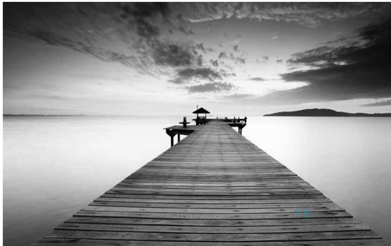
Photo Title HereRenimuste liquis quatem eruptae aperias dus maximax imporectiis audam ilibus demet ad que volestibus et Ad quundi dolum sunt