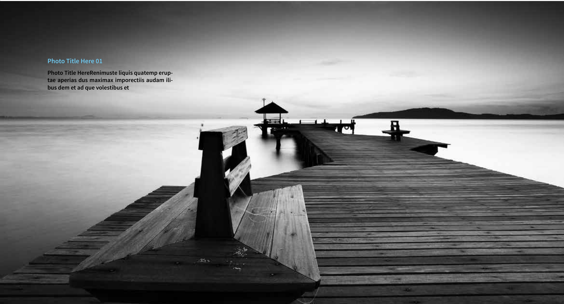
Photo Title HereRenimuste liquis quatemperuptae aperias dus maximax imporectiis audam ilibus dem et ad que volestibus et